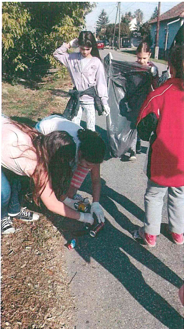
TOP-5.3.1-16-BK1-2017-00019 Helyi identitás és kohézió erősítése Dusnok térségben pályázat keretén belül 2020.03.27. napján megtartott „Szemétszedés Fajszt utcáin „