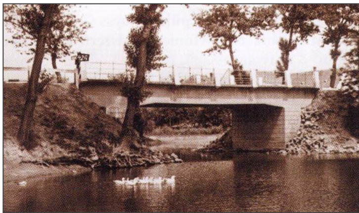
Dusnok, Vajas-foki vasbeton gerendahíd. (Épült 1930-ban)

– Ha időnk engedi szívesen látogatunk haza, számunkra ez nagyon fontos, igazi feltöltődés. Rác Pünkösdre minden évben