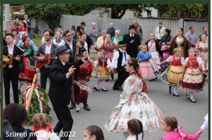
Szüreti mulatság 2022