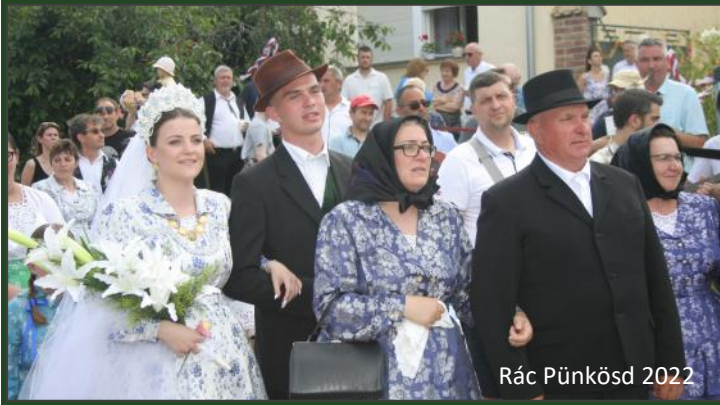
Rác Pünkösöd 2022