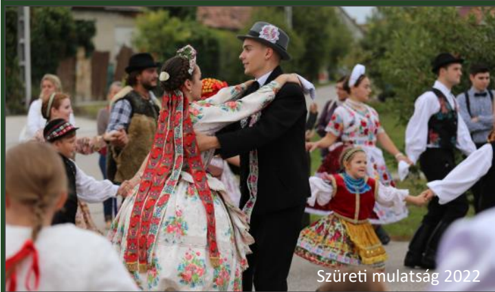
Szüreti mulatság 2022