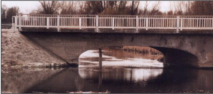
Dusnok, 1.sz. főcsatorna-híd

elmegyünk, mivel a hagyományőrzést és a népszokásokat nagyon szeretjük. A rendezvényt példaértékűnek tartom a jövő nemzedéke számára, ezen az alkalmon szoktam találkozni sok gyerekkori ismerőssel, barátokkal. A Vajas-parti sétányt minden alkalommal, ha otthon vagyunk, végigsétáljuk, fiam mindig mondja, hogy apa, meglocsoljuk a fát. Ha már szóba került a Vajas, akkor szeretnék pár információt megosztani a „nagyhíd”-ről, ami a két világháború közt 1930-ban épült. Ez egy 14 m szabad nyílású mo-