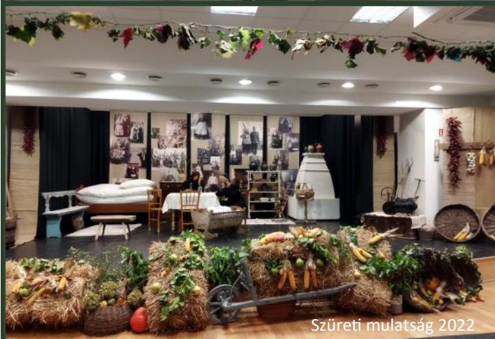
Szüreti mulatság 2022