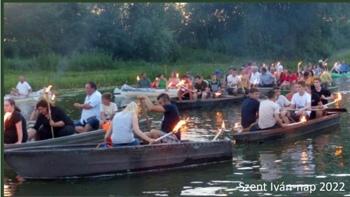
Szent Iván-nap 2022