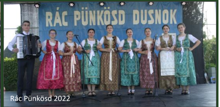
Rác Pünkösöd 2022