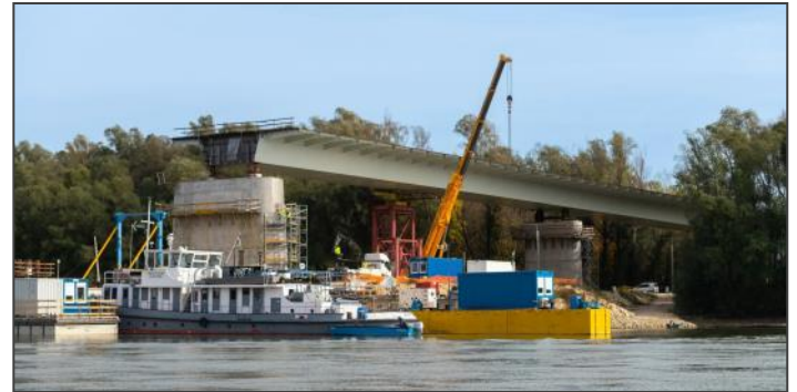
Az épülő új Kalocsa-Paks Duna-híd

– Az egyetem után a Merkbau Kft.-nél kezdtem dolgozni, mint munkahelyi mérnök, jellemzően magasépítési projekteken. Mivel a diplomámat acélszerkezeti szakirányon szereztem, azt gondoltam, hogy ezen a területen is szeretném kipróbálni magam. Így 2009-ben fordulatot vett a pályafutásom,