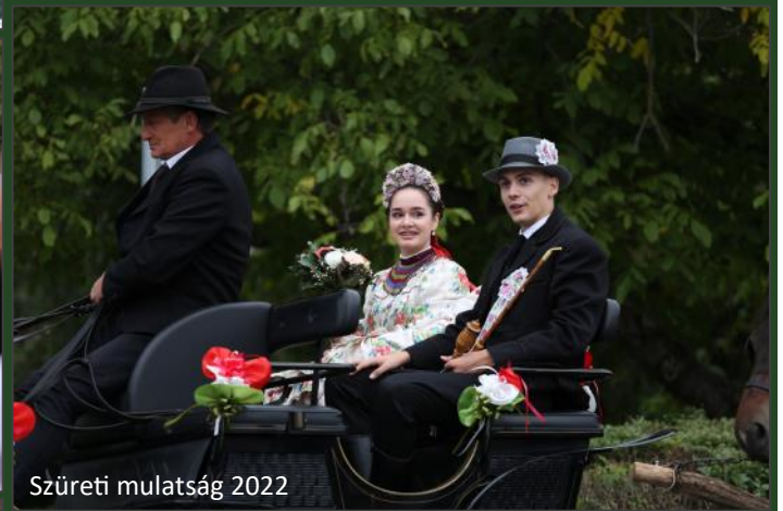
Szüreti mulatság 2022