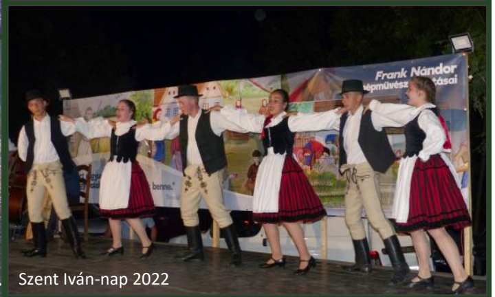
Szent Iván-nap 2022